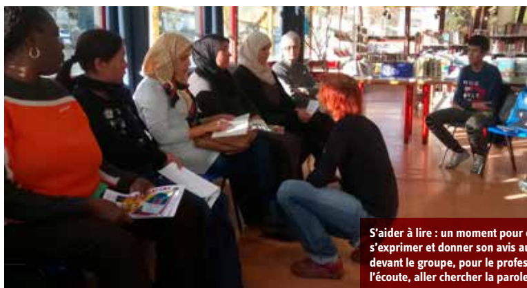
S'aider à lire : un moment pour oser s'exprimer et donner son avis autour d'un livre devant le groupe, pour le professionnel, être à l'écoute, aller chercher la parole.

Tous ont en commun le désir de progresser en français.